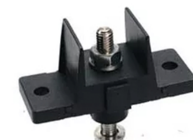
Ponto de Interconexão Cód.: 1.999.06.017