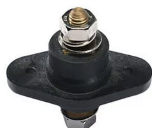
Conjunto Borne de ligação M8 Cód.: 1.999.33.014