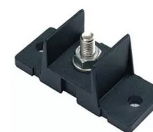
Conjunto Conexão com abas Cód.: 1.999.06.018