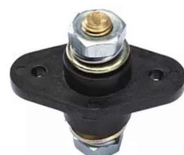
Conjunto Borne de ligação M10 Cód.: 1.999.33.016