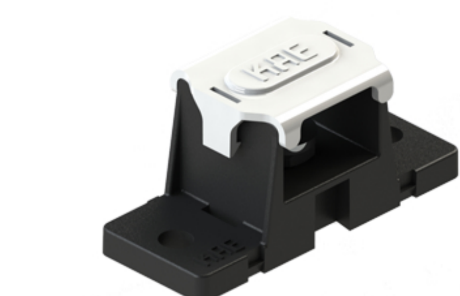
Ponto de Conexão com Abas Especiais M6 Cód.: 1.999.06.053