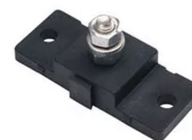
Conjunto Conexão sem abas Cód.: 1.999.06.016