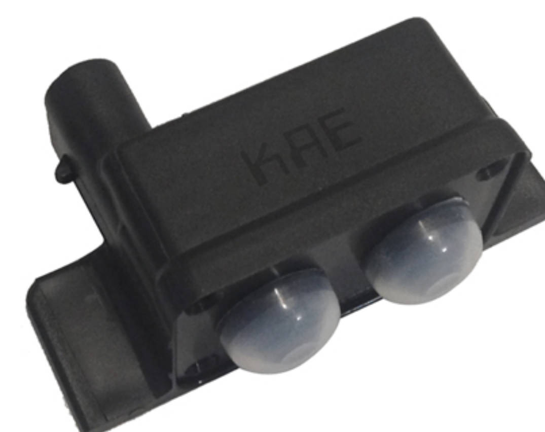
Caixa de Comando com Conexão Selada Cód.: 7.999.29.007